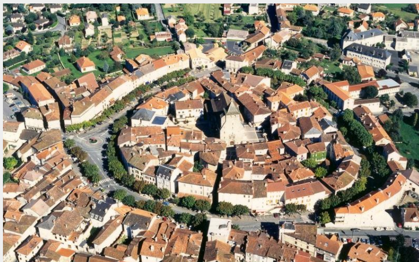
Mours (OT Châtaigneraie)