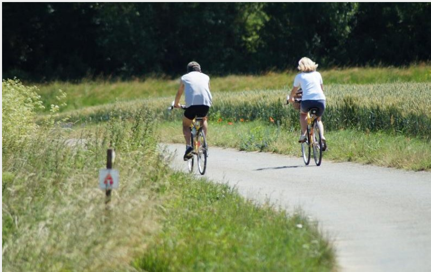
VTTiste (OT Forez Est)