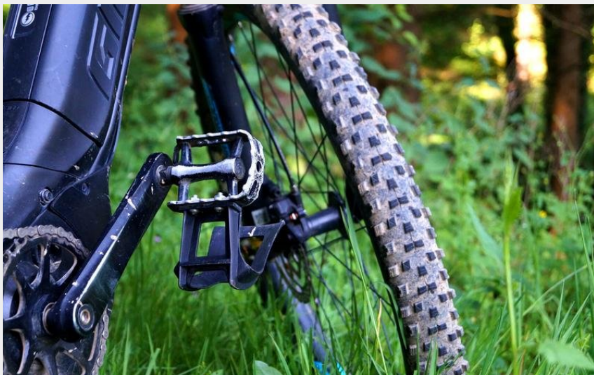
VTT (OT Forez Est)