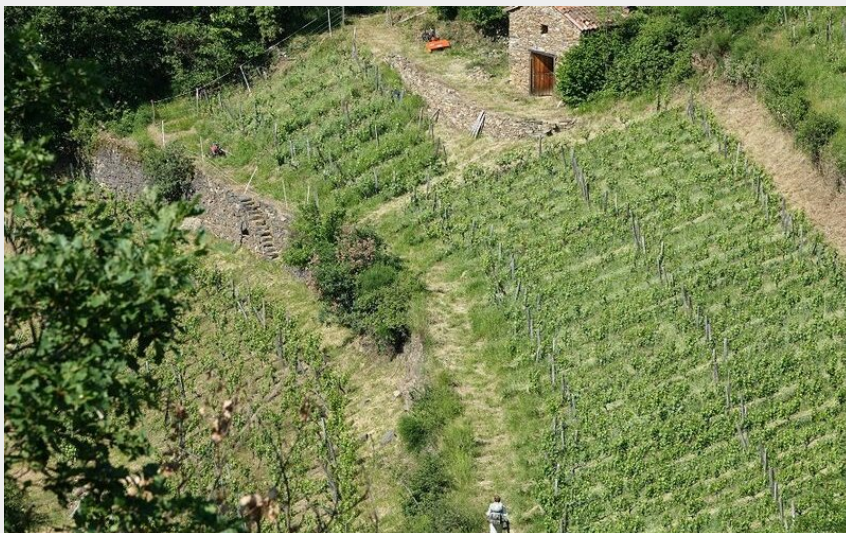
Palhàs de Molompize