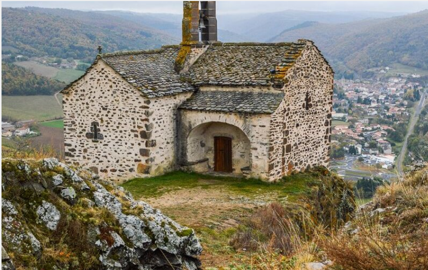
Chapelle Sainte-Madeleine