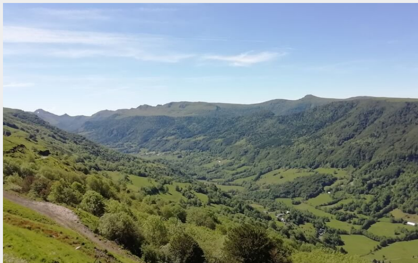
Depuis le col de Légal (OT Pays de Salers)