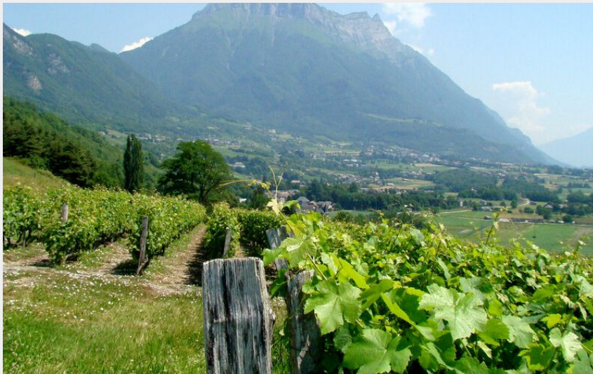
Vue sur le massif des bauges