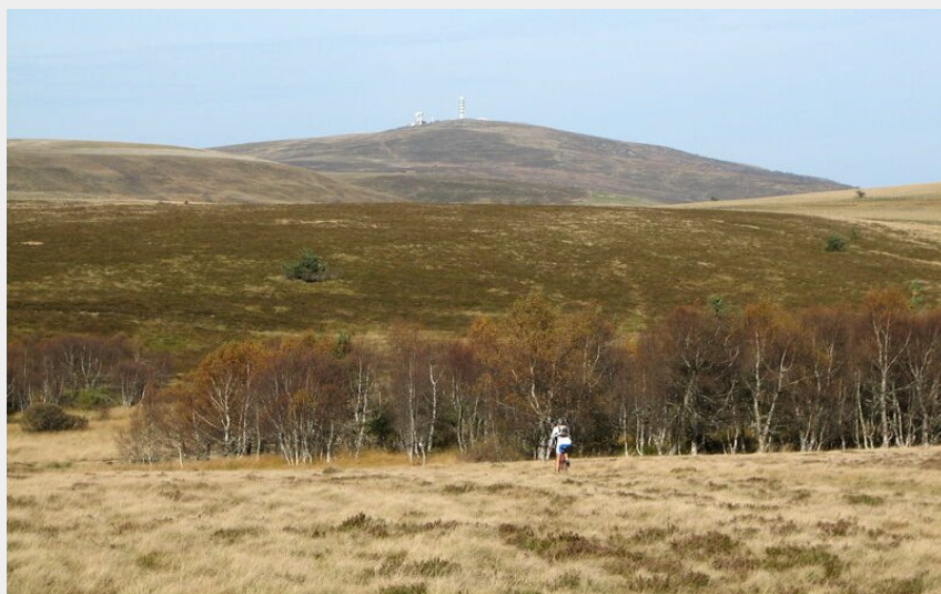
VTT Sur les Hautes-Chaumes