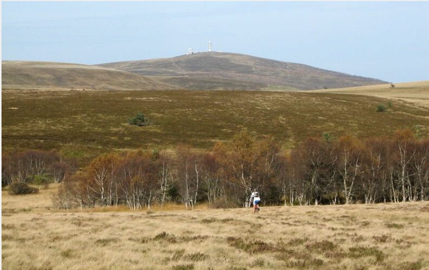
VTT Sur les Hautes-Chaumes