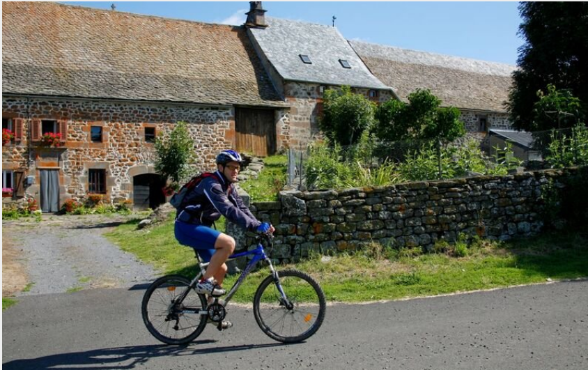
Planèze de Saint-Flour, Cantal, Auvergne (H. Vidal)