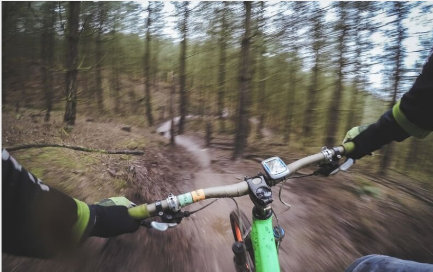
Itinéraire VTT