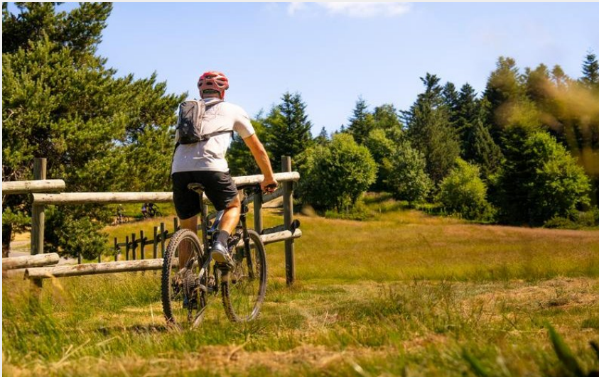
N°61 - Le novice - Espace VTT-FFC Massif des Bois Noirs_La Chamba