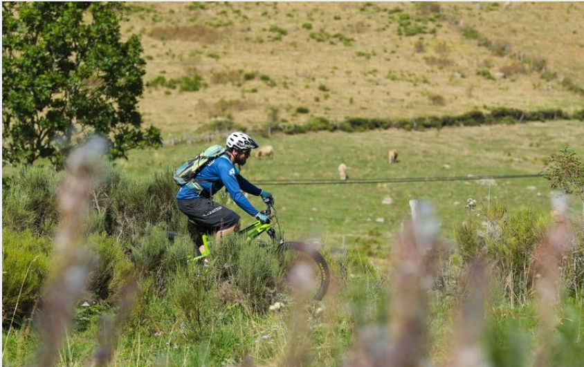
circuit VTT vers chaudes-aigues (H VIDAL)