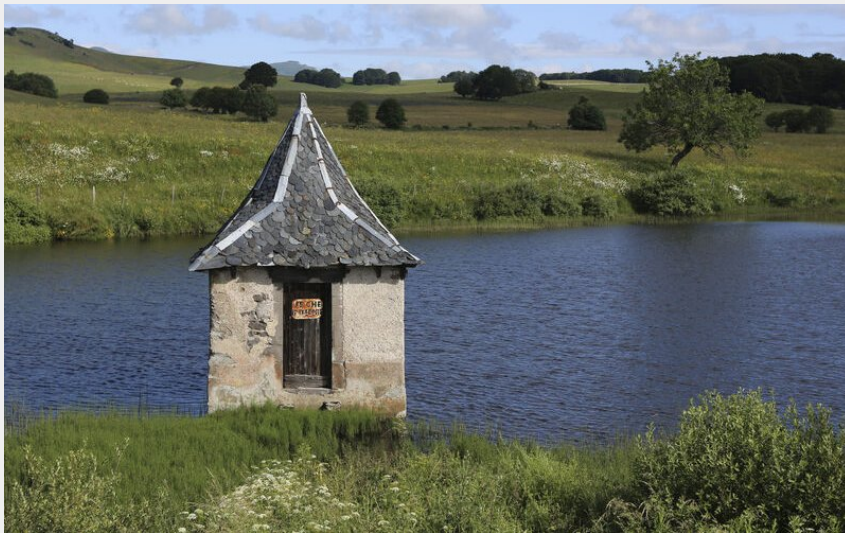
la fage cezens