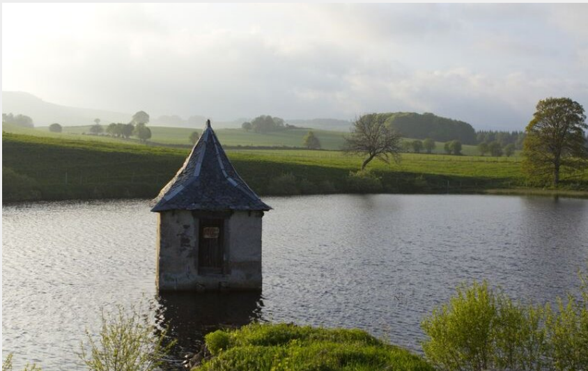
La fage Lac Hervé Vidal