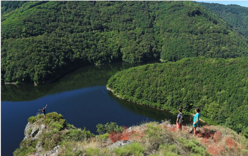
Lac de Vezou gorges de la Truyère