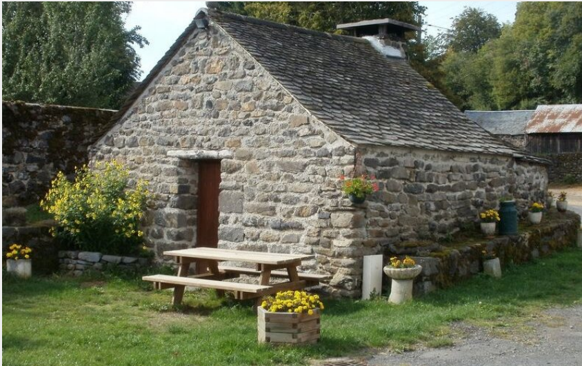
La voie de rochebonne