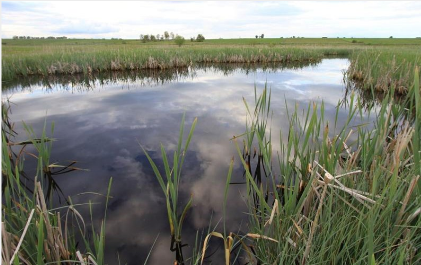
Narse de Lascols, Cantal, Auvergne (saint-flour co)