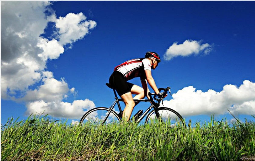
Cyclisme en Isère