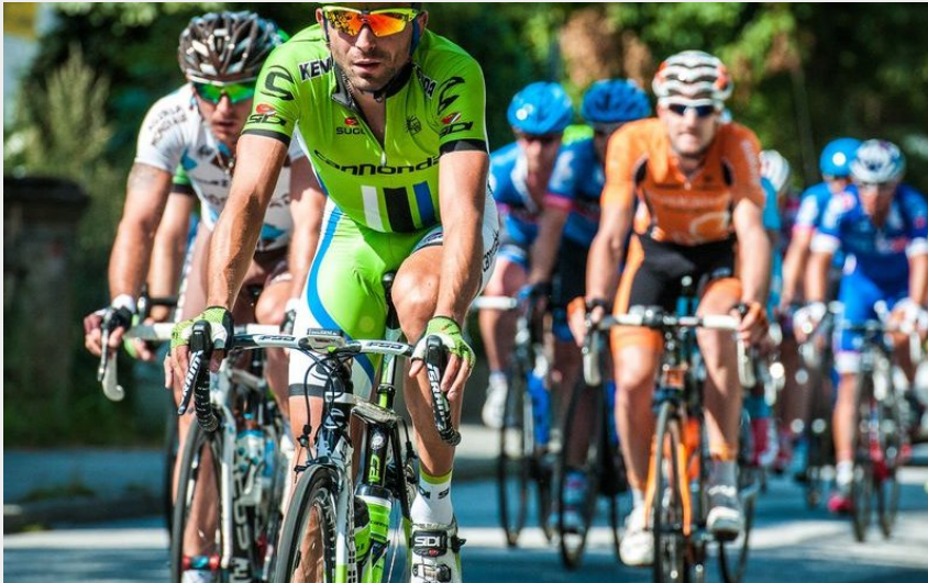
Cyclo col de montagne