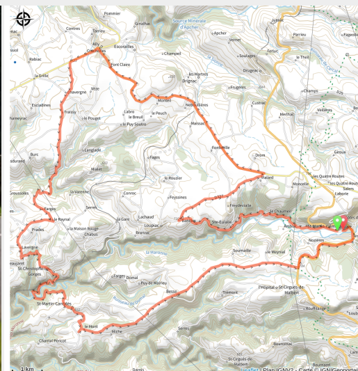
Cyclo en Pays de Salers