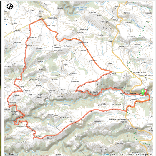
Cyclo en Pays de Salers

Rapprochez vous de la Xaintrie cantalienne en passant par Saint-Christophe-les-Gorges, Ally..