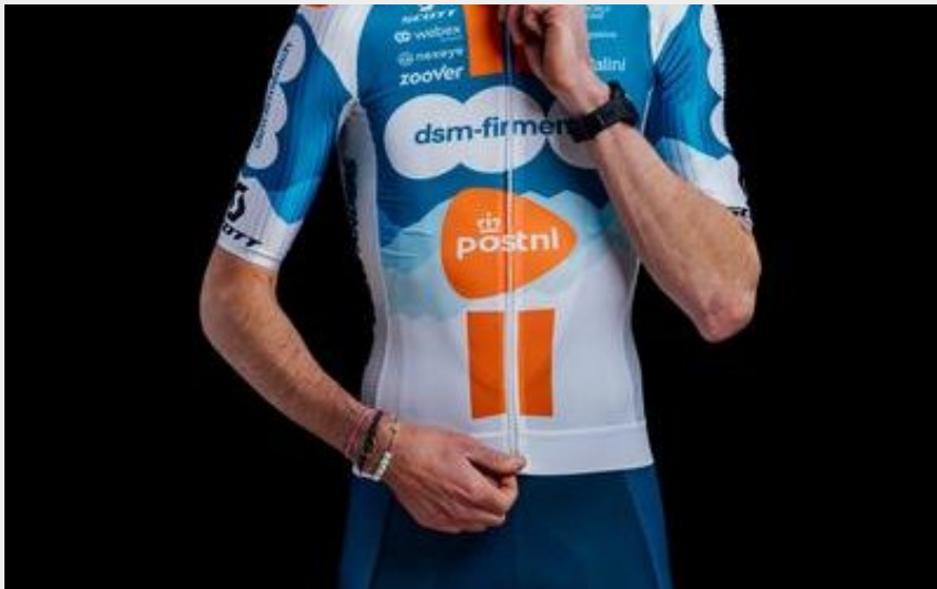
Romain Bardet Experience Saint-Flour Cantal