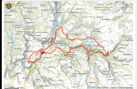
Romain Bardet Experience Sumène Artense Cantal