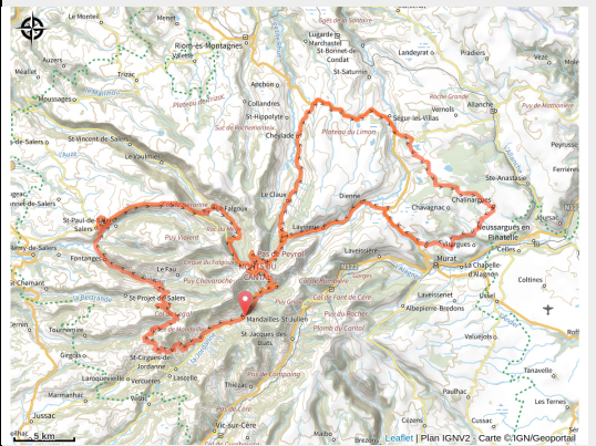
Romain Bardet Experience Volcan Cantal