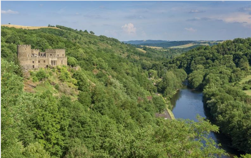
Château de Chouigny et vallée de la Sioule (Luc OLMIER)