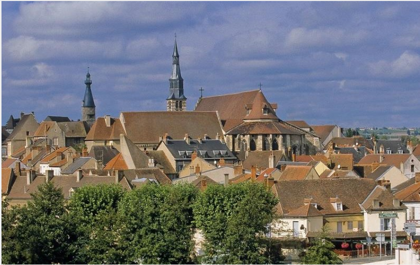
Saint-Pourçain-sur-Sioule (Luc OLIVIER)