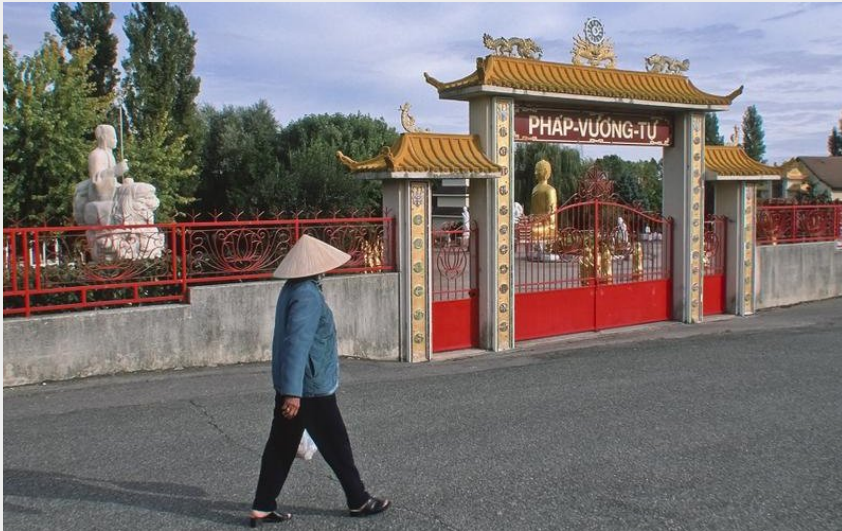
Pagode de Noyant (Luc OLIVIER)