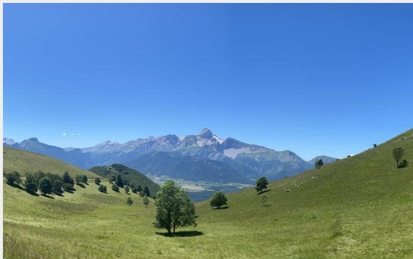
Montée de la Salette (CC Matheysine)