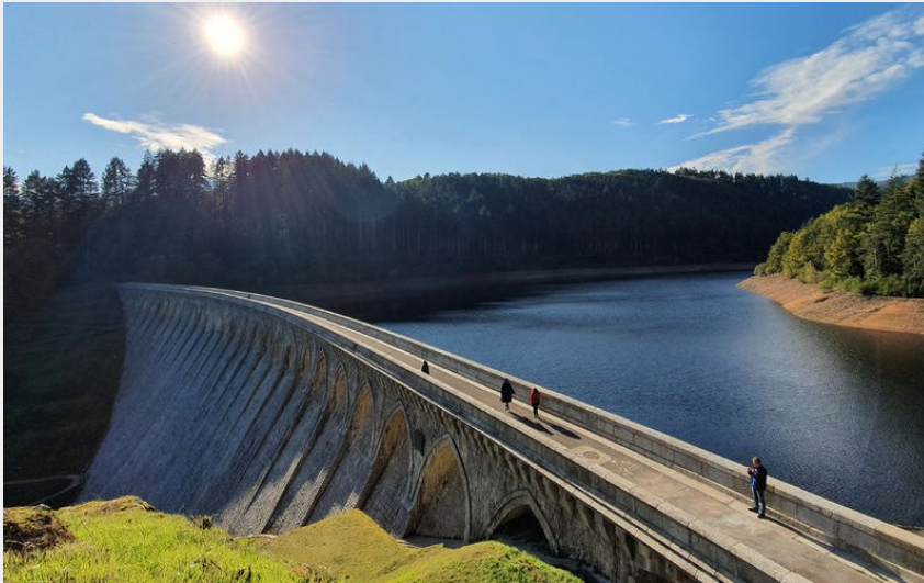
Barrages de Renaison (@adelinev38)