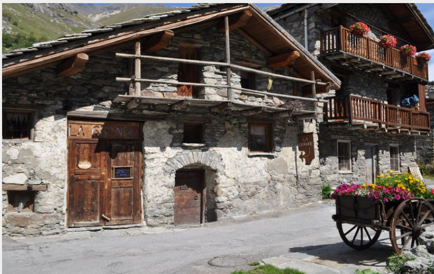
Bonneval-sur-Arc (Laurence Padeloup)