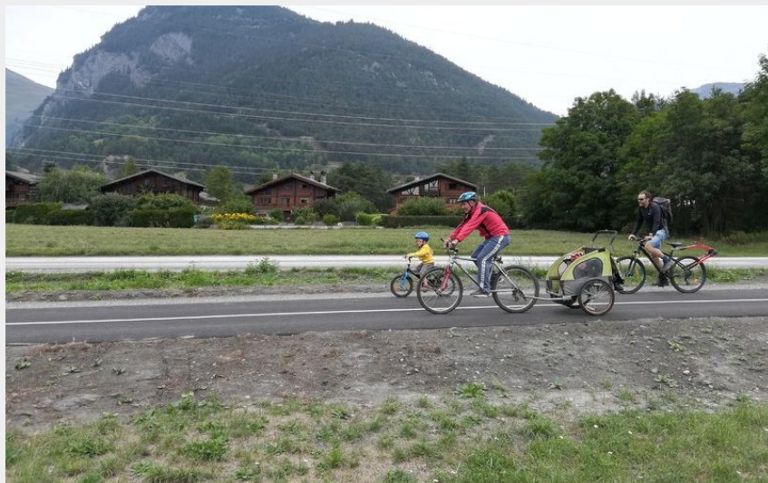
Voie verte (CCHT)