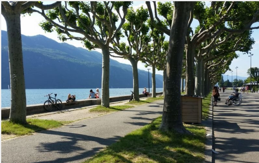
l'esplanade du lac (Sarah Xuereb - Agate)