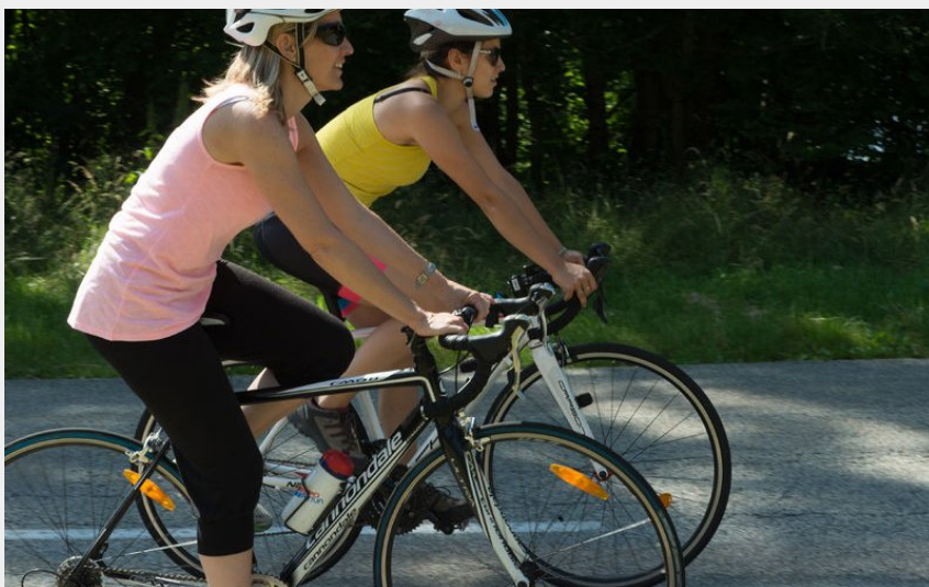
(Miason du Tourisme d'Albertville - Alain MORANDINA)