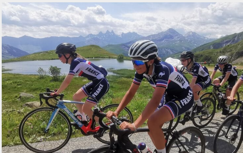
Equipe de France Juniors - Juillet 2021