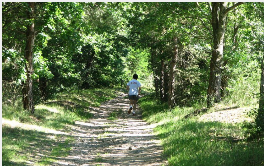
Aventure du rail (Anne Massip)