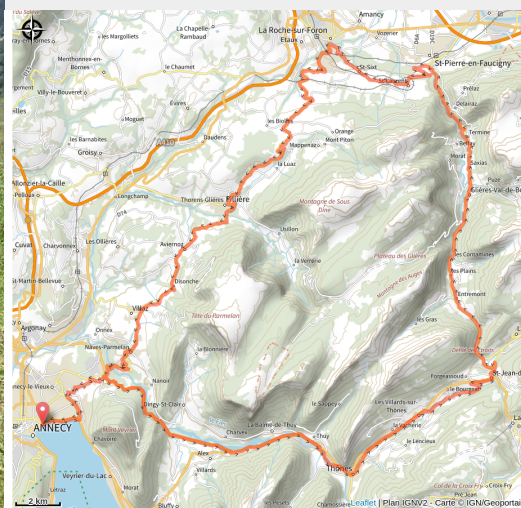
Tour des Glières - Itinéraire cyclo_Annecy

Labellisé "Vélo et Fromages", ce circuit préalpin offre d'abord une belle incursion dans le cœur des Aravis par ses fonds de vallée, puis parcourt les collines du piémont en empruntant majoritairement de petites routes.