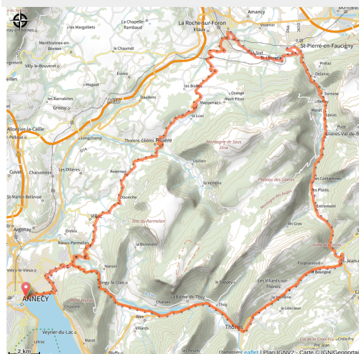
illustration v&f (@D.HEMAR - illustrations @M.ASSENAT - ADF)

Labellisé "Vélo et Fromages", cet itinéraire offre une belle incursion dans le cœur de la vallée de Thônes et des Aravis à la découverte de sa gastronomie. A ne pas manquer le plateau des Glières, haut lieu de la Résistance française.