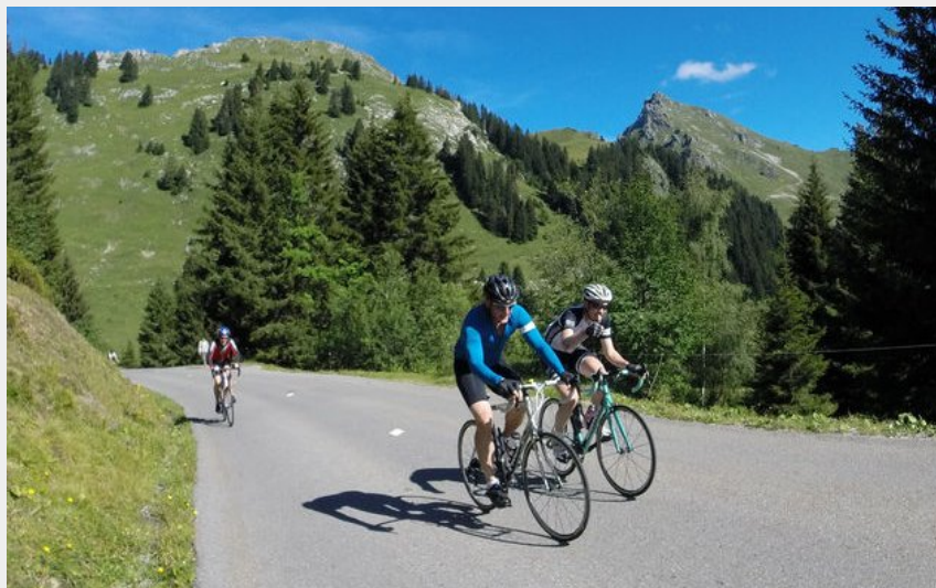
Le Col de la Ramaz - Alt. 1619 m