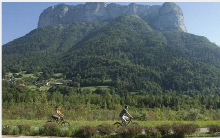
Tour Tournette (Conseil général 74)