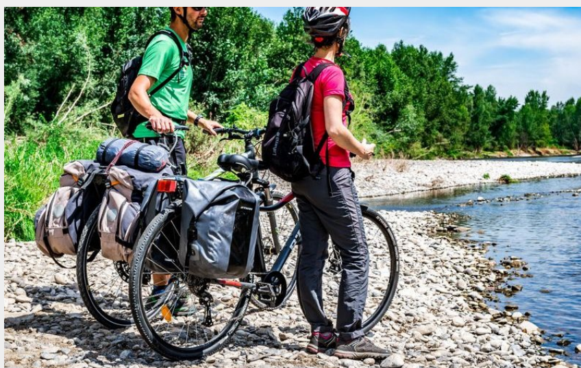
Via Allier - La véloroute de l'Auvergne