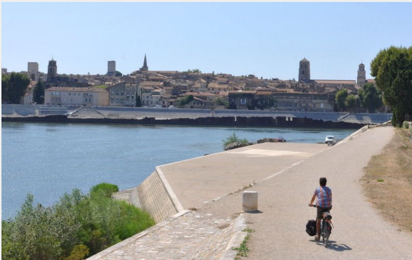
Arrivée à vélo sur Arles dans les Bouches-du-Rhône