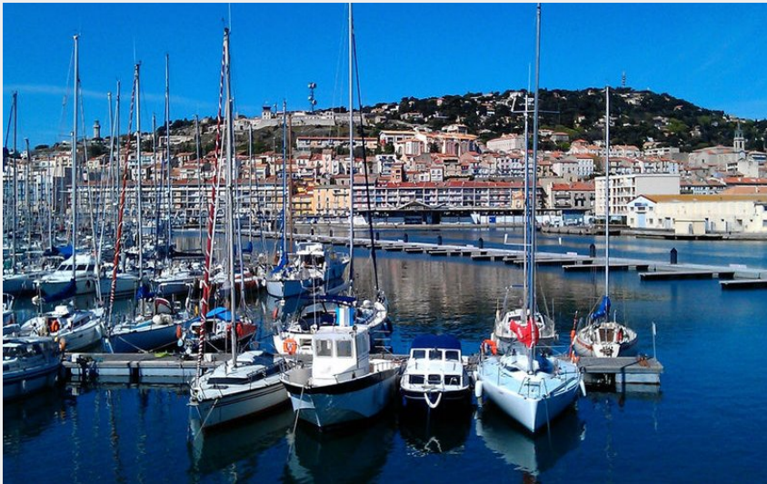
Le Port de Sète (E. Brendle)