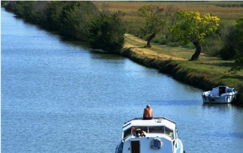
Bateau sur le canal du Rhône à Sète vers Gallician