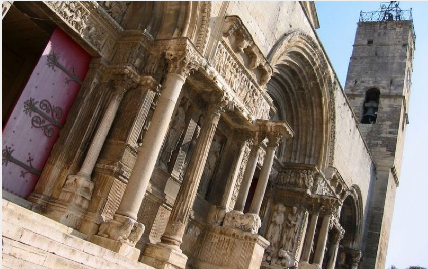
Abbatiale de Saint-Gilles (Mairie de Saint-Gilles)