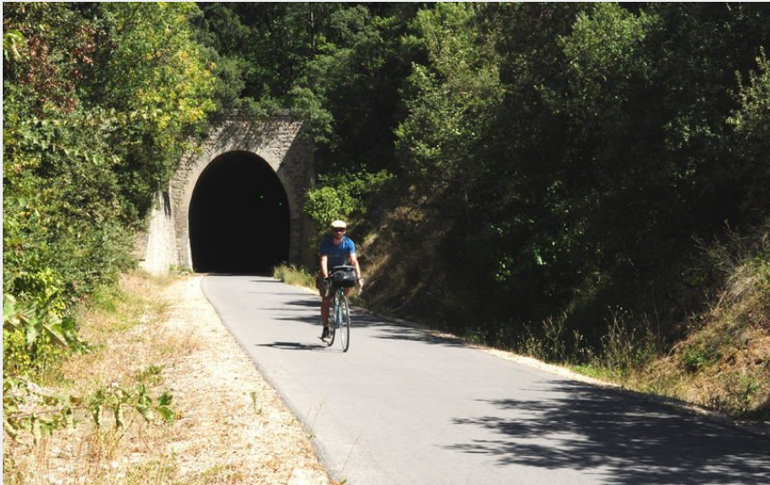
Piste cyclable sous le tunnel de Montfrin