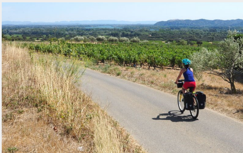
ViaRhôna à travers le vignoble de Châteauneuf-du-Pape