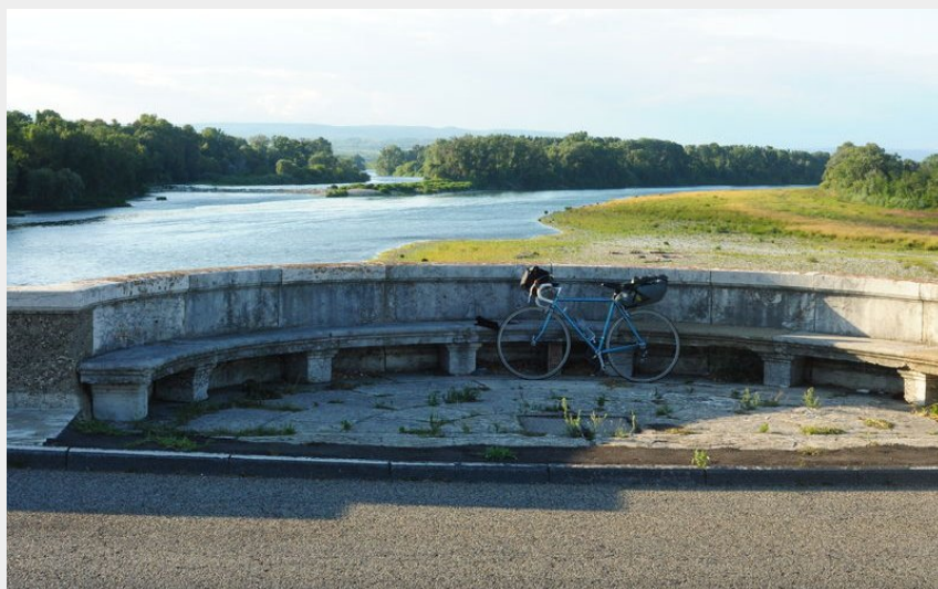
Le Rhône vu du vieux pont de Pont-Saint-Esprit