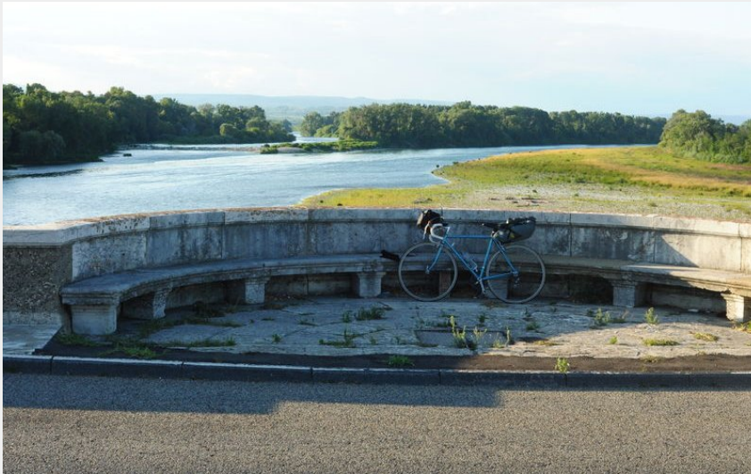
Le Rhône vu du vieux pont de Pont-Saint-Esprit