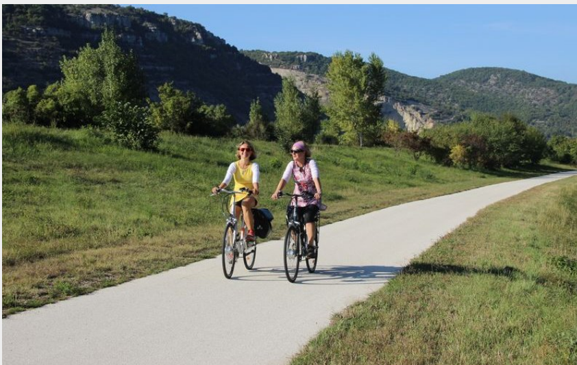
Piste cyclable sur ViaRhôna en Ardèche (Frankrijk)