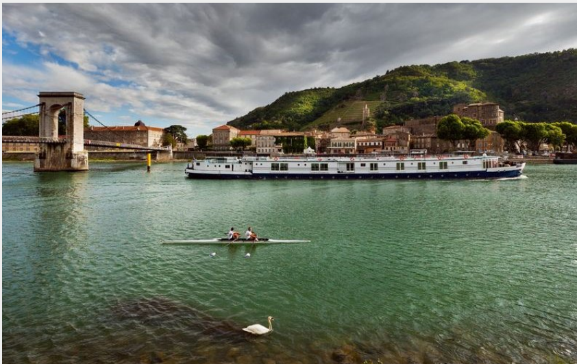
Bateau de croisière à Tournon-sur-Rhône