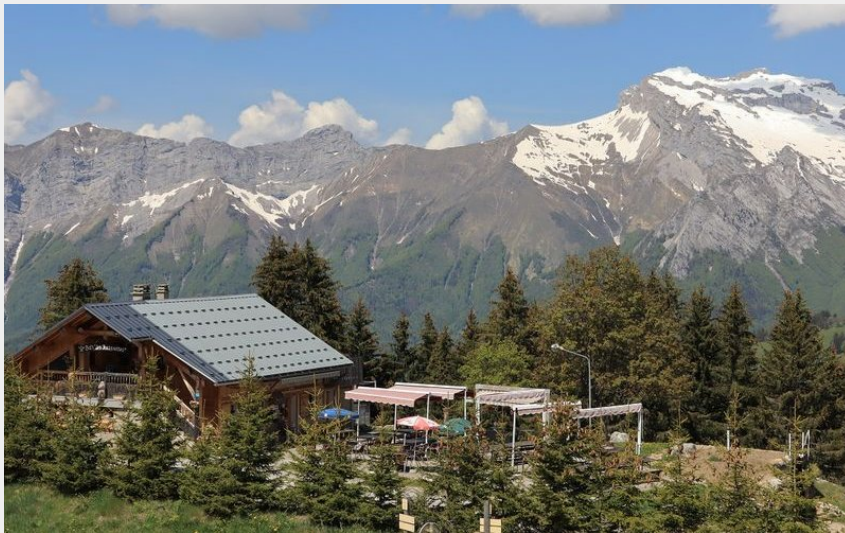
Vue Auberge des Fontanettes - Le Bouchet-Mont-Charvin