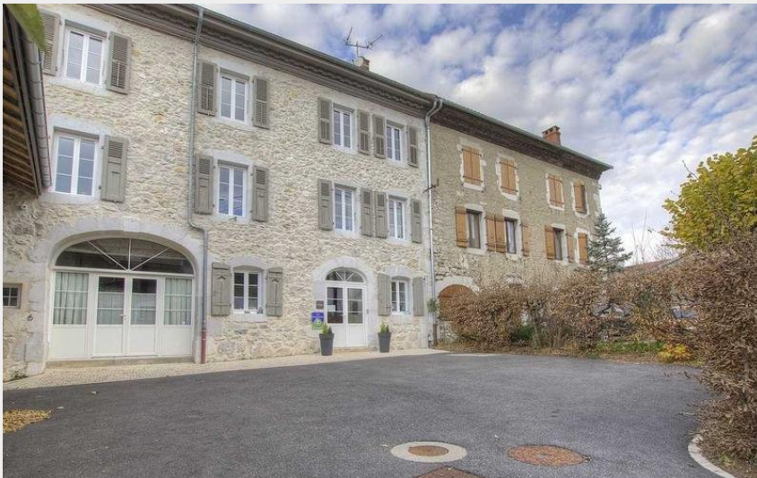
Façade de La Colonie côté rue du fort