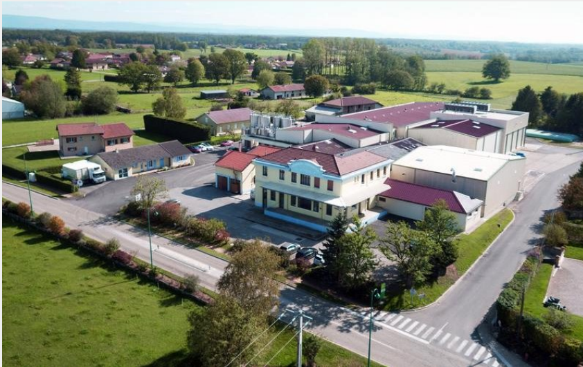
Vue aérienne de la Laiterie Coopérative d'Étrez